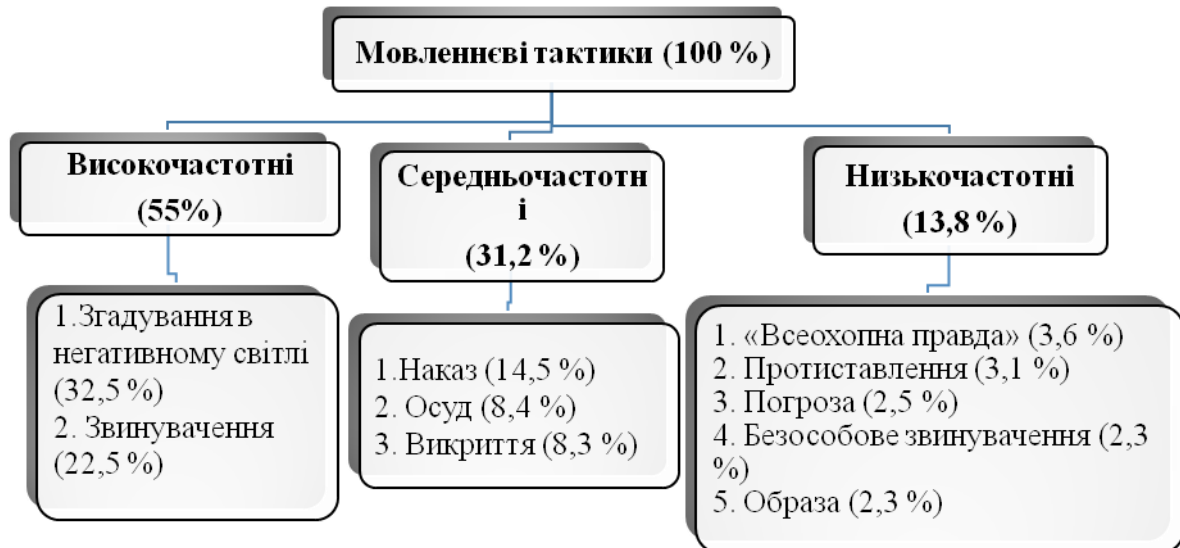
Рис. 2. Мовленнєві тактики, що реалізують стратегію дискредитації в промовах дипломатів (за критерієм частотності)

Отже, у досліджуваних текстах промов дипломатів за критерієм частотності вживання ми виокремлюємо три групи тактик, що реалізують стратегію дискредитації (див. Рис. 2).